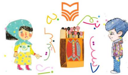
شکل ۱۰. انتخاب راوی

شخصیت‌ها صحبت می‌کنند. در سه کتاب: دست بزنم به کبریت، دست بزنم به چاقو و دست بزنم به قلیون خواننده می‌تواند تعیین کند شعر با صدای دخترانه یا صدای پسرانه خوانده شود (شکل ۱۰). در همین سه کتاب پیش از وارد شدن به برنامه به خواننده آموزش داده می‌شود که نقاط قابل لمس و ضربه‌زدن (هات اسپات‌ها) در صفحه از نظر ظاهری چه ویژگی‌هایی دارند (شکل ۱۱). در سایر کتاب‌های تعاملی این ناشر قسمت‌های هات اسپات مشخص نبودند و بر حسب اتفاق مورد شناسایی قرار می‌گرفتند.