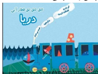
شکل ۵. صفحه اول کتاب قطار آبی: دریا

در این مجموعه نیز برای شروع خواننده باید بتواند کلمات را بخواند (شکل ۵). مخاطب با ضربه‌زدن روی تصاویری که هات اسپات هستند (یا در مواردی کشیدن) آن‌ها را به حرکت می‌آورد یا ظاهرشان را تغییر می‌دهد