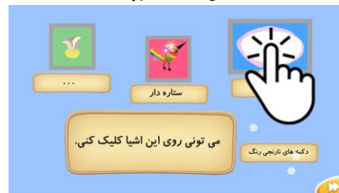
شکل ۱۱. آموزش نقاط هات اسپات

راهنماهای مناسب برای حرکت در صفحات کتاب در نظر گرفته شده است. در برخی از کتاب‌ها جورچینی از شخصیت‌ها یا صفحات کتاب برای بازی خواننده در نظر گرفته شده است. این جورچین در روند داستان تأثیری ندارد و فقط جنبه سرگرمی برای خواننده دارد و نمی‌توان آن را یک کتاب‌بازی در نظر گرفت.