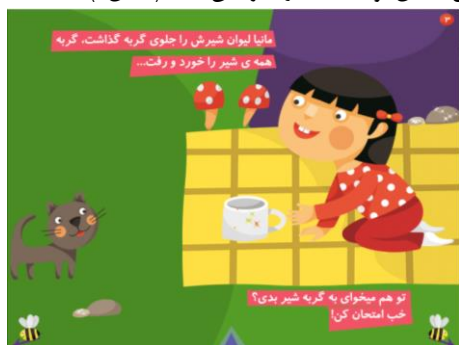
شکل ۳. پرسش از خواننده برای تعامل

محتوای نسخه چاپی کتاب داستانی مانیا برای کتاب تعاملی بازنویسی و مناسب‌سازی شده است و به همین دلیل متن نسخه کتاب تعاملی نسبت به نسخه چاپی تفاوت‌هایی دارد. در نسخه چاپی برای خواننده نیز نقشی در نظر گرفته شده و روایت داستان تعاملی شده است. به عنوان نمونه در کتاب روزی که مانیا مهربان شد علاوه بر متن نسخه چاپی در کتاب تعاملی پرسشی اضافه شده است تا تصمیم‌گیری و انتخاب خواننده در مسیر داستان تعاملی او با کتاب را افزایش دهد (شکل ۳).